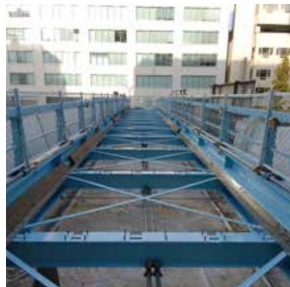
③アルミ床版取付金具セットと側溝の設置。再塗装も施す