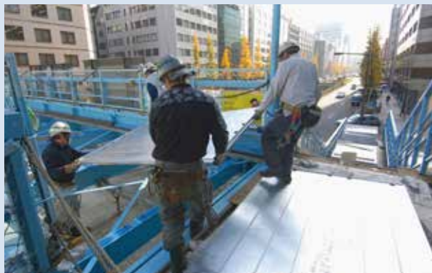
4人で搬送から設置までできます

アルミ床版は1枚が約70kg(1.3m×1.95mパネル)と軽く、人力のみで取り扱うことができます。これにより、歩道橋改修に伴う大規模道路規制は必要としません。