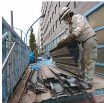
②デッキプレートは運搬できるように細かく溶断