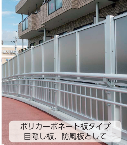
ポリカーボネート板タイプ 目隠し板、防風板として