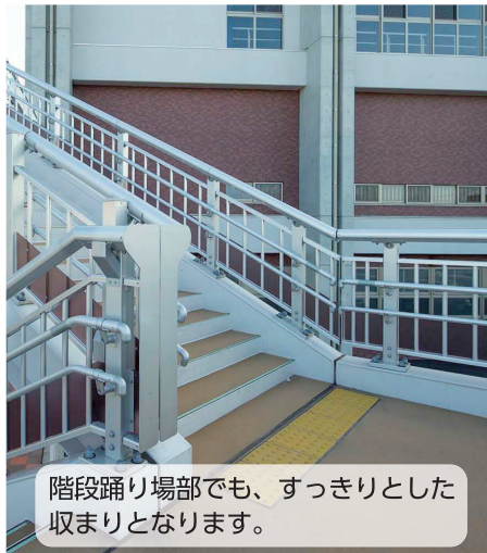
階段踊り場部でも、すっきりとした 収まりとなります。