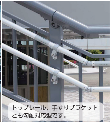
トップレール、手すりブラケット とも勾配対応型です。