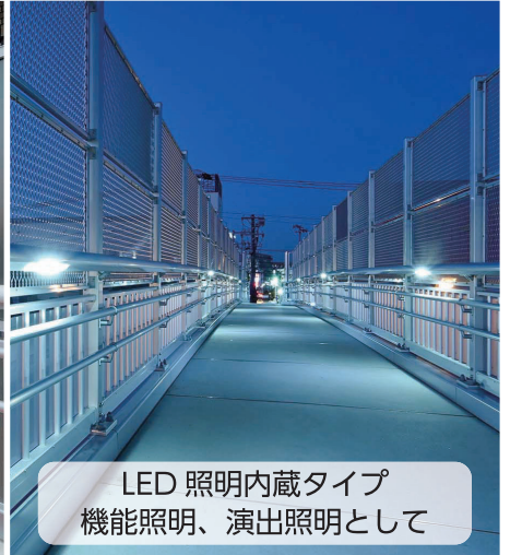
LED 照明内蔵タイプ 機能照明、演出照明として