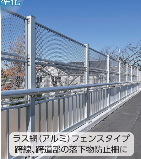
ラス網(アルミ)フェンスタイプ 跨線、跨道部の落下物防止柵に